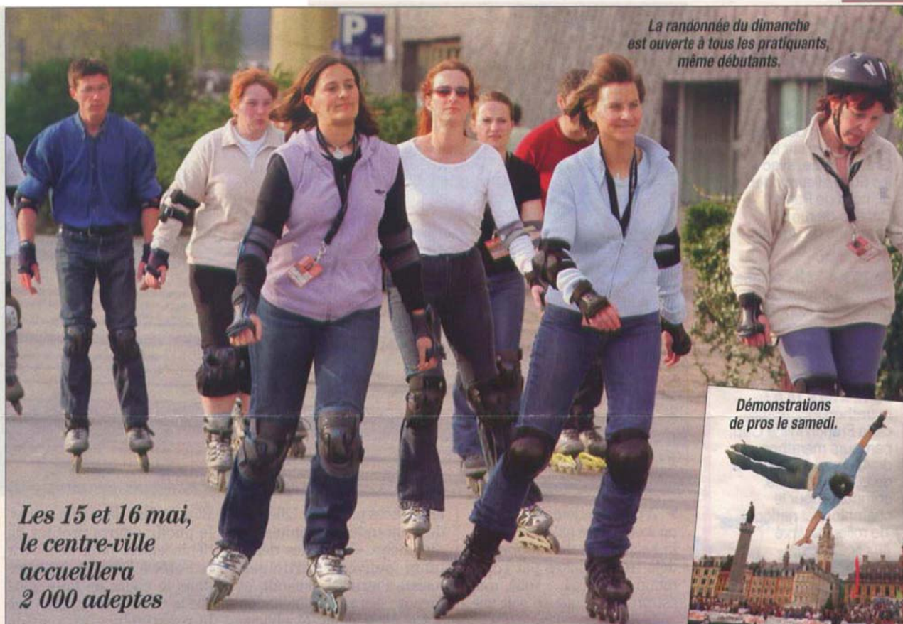
La randonnée du dimanche est ouverte à tous les pratiquants, même débutants.

Les 15 et 16 mai, le centre-ville accueillera 2 000 adeptes