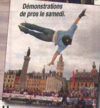
Démonstrations de pros le samedi.

Les 15 et 16 mai, le centre-ville accueillera 2 000 adeptes