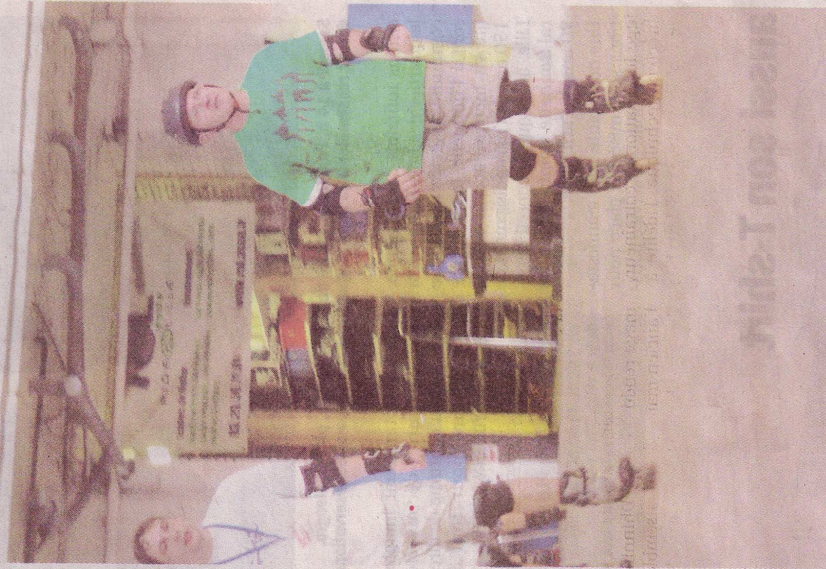
Le samedi matin de 10h à 11h30, la ROL School propose des cours de roller pour les 50 ans et plus.

« Je suis inscrite depuis deux ans. J'ai commencé tout doucement et maintenant je viens régulièrement. Pour pouvoir se faire plaisir en toute sécurité en roller, il faut suivre des cours ! »