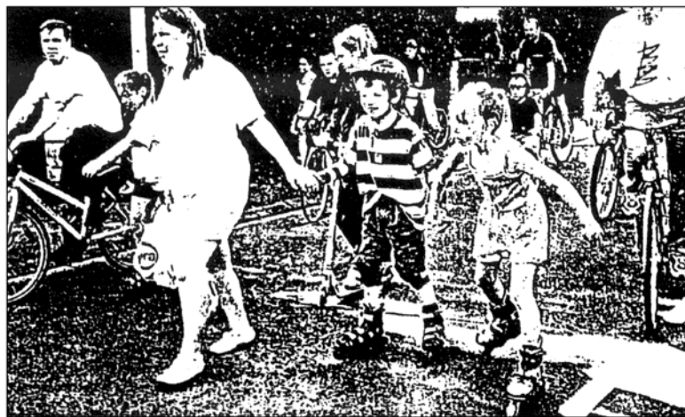
Toutes les roues et roulettes étaient les bienvenues : les rollers, les patinettes et les vélos. A Wattignies, on s'est promis de recommencer l'année prochaine

elle a rallié à sa cause tous les Wattignisiens qui ne sont pas partis en vacances. Une centaine de personnes composaient le défilé, mais ils étaient dix fois plus nombreux à se retrouver en fin d'après-midi sur l'esplanade du centre culturel, où une fête était organisée.